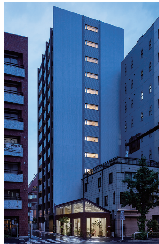
▲2020年度グッドデザイン賞受賞の(レクシード秋葉原)(2020年9月募集済)左・右中央:外観、右下:離れ、右上:グッドデザイン賞ロゴ

「量から質」「モノよりココロ」…。時代とともに変化する多様なニーズに的確に応え、住まう人が求める真の価値を具現化した住宅を提案するジェイレックス・コーポレーション。豊富な実績と確かなノウハウを駆使し、プロフェッショナルとしての的確なコンサルティングによる不動産事業を幅広く展開。常に不動産業界の固定観念にとらわれず、時代に合った新しい価値を発信し続ける。