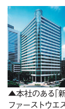
▲本社のある「新宿ファーストウエスト」

2014年 ・マンズリーマンションを開始 2016年 ・台湾サロンを出店 2017年 ・全マンションIoT機器標準装備 ・プライバシーマークを取得 ・グッドデザイン賞を受賞 2018年 ・IoTホテルをオープン ●宅地建物取引業免許 東京都知事(4)第81371号 ●一級建築士事務所 東京都知事第56723号 ●マンション管理業者登録 国土交通大臣(3)第033058号 ●賃貸住宅管理業登録 国土交通大臣(1)第5986号 ●(一社)全国住宅産業協会会員 ●(公社)首都圏不動産公正取引協議会加盟 ●(公社)東京都宅地建物取引業協会会員 ●(公社)全国宅地建物取引業保証協会会員 ●(一社)不動産テック協会会員