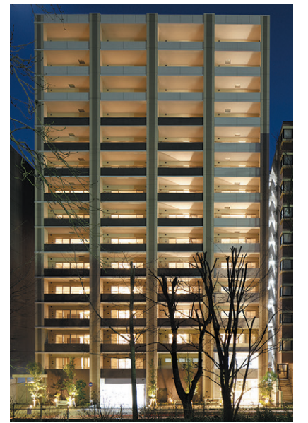
▲左(新宿イーストクロスタワー)外観(2018年1月募集済) 右(レアシス新横浜 パークフロント)外観(2016年分譲済)