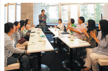
▲居住者や地域の皆様とのサークル・セミナー活動のシーン