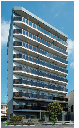
▲左(レクシード神楽坂)外観(2020年4月募集済) 中央(レヴィア文京音羽)外観(2019年12月募集済) 右(レオーネ高島平)(2020年8月募集済)