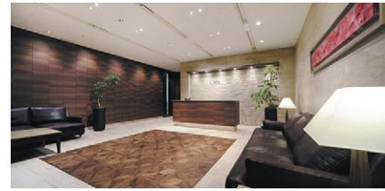
▲本社エントランス