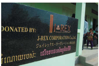
▲左:カンボジアオートム小学校 右:交通安全教室を行い黄色い帽子をプレゼント